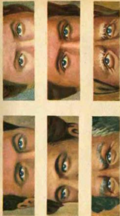
Рис. 1. Подклеивание грима

Носы бывают разные — короткие и крючковатые, прямые и изогнутые (рис. 46). Клеят гузмоза на сухую, не покрытую вазелином кожу, предварительно удалив с нее пыль и пот. Под большие накладки приклеивают кусочек ваты, тогда они лучше держатся на носу. Свер-