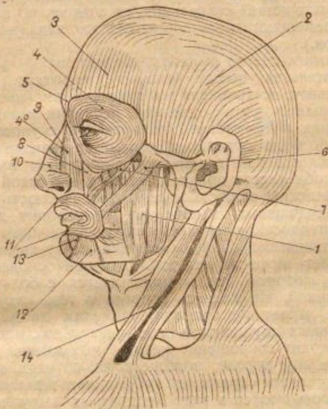
№ 4. Мышцы экспрессий.

Мышцы встречаются в большем количестве, чем кости. Они обладают способностью сокращаться от раздражения нервов, от действия нашей воли или от влияния других возбудителей, как например гальванизма. Каждая мышца состоит из толстых пучков волокон, которые лежат параллельно друг другу или соединяются под различными острыми углами. Большие и меньшие пучки имеют оболочки из соединительной ткани. Каждый пучок есть совокупность различае-